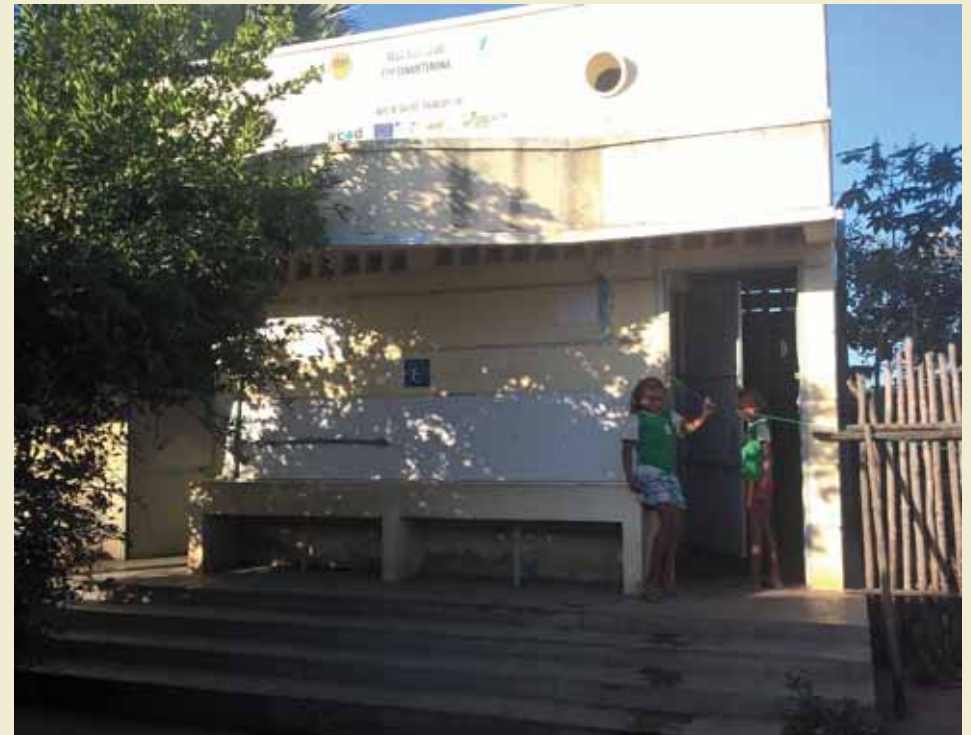
BS EPP Fanantenana