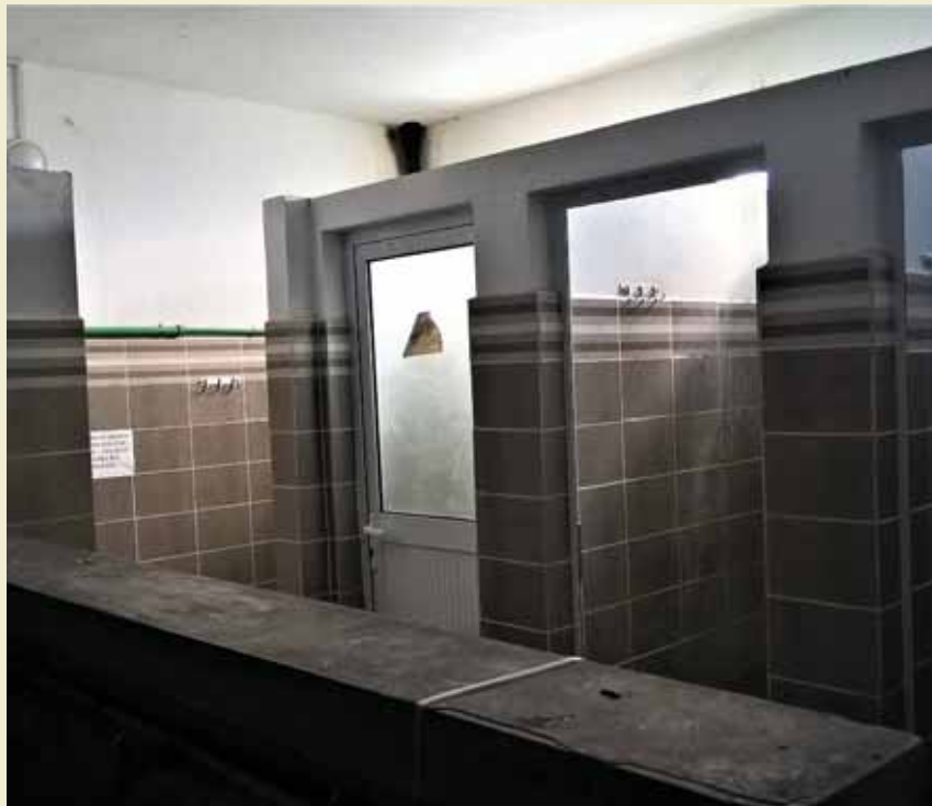
BS urgence CHU Androva