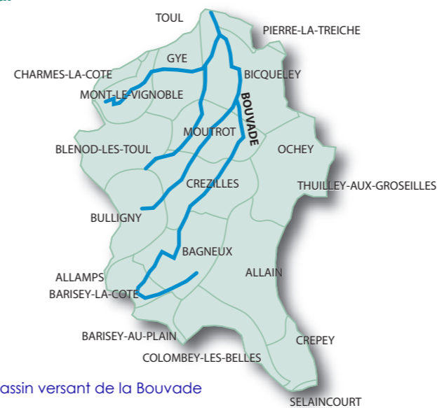
Bassin versant de la Bouvade

Aujourd'hui, la Bouvade n'est pas en bon état. Des travaux sont donc nécessaires pour obtenir une meilleure qualité de l'eau.