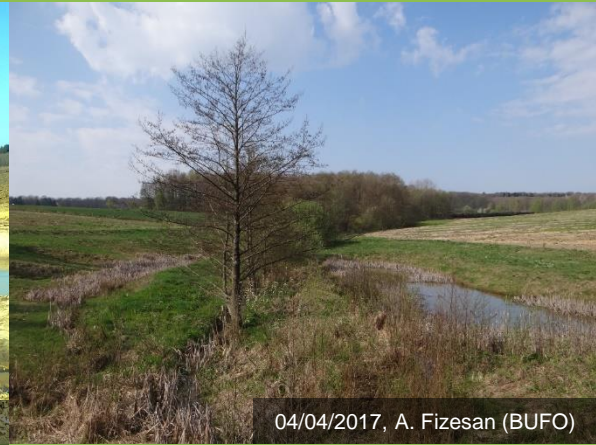
04/04/2017, A. Fizesan (BUFO)