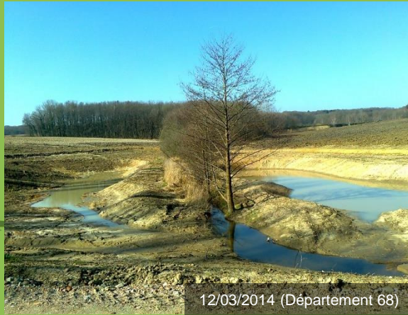
12/03/2014 (Département 68)