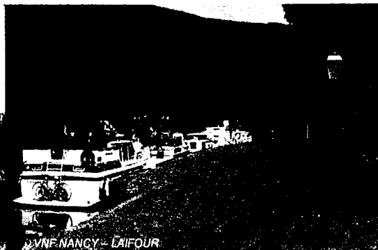
VNF NANCY - LAIFOUR