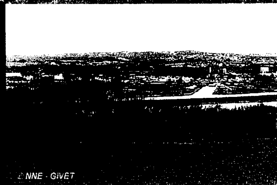
NNE - GIVET