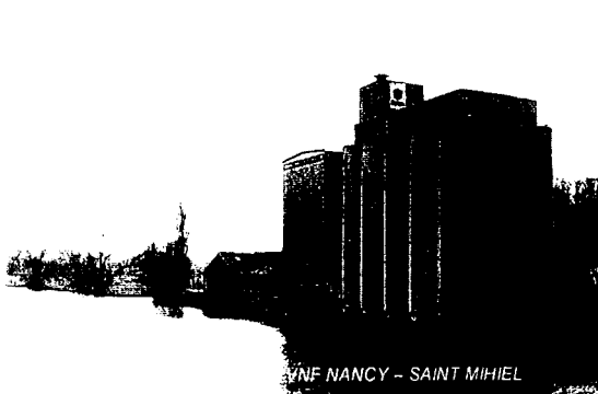
VNF NANCY - SAINT MIHIEL

UN POTENTIEL ECONOMIQUE EXISTANT POUR LE TOURISME DANS TOUTE LA VALLEE MEUSIENNE , UN ENJEU DE DEVELOPPEMENT DURABLE ET DE MAITRISE DES RISQUES NATURELS