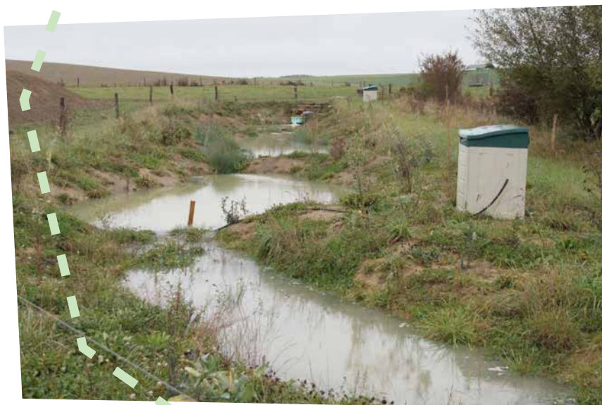
Exemple d'une zone tampon suivie pour mesurer l'effet épuratoire

L'ensemble de ces points ont justifié de poursuivre les investigations sur de plus longues durées à la fois pour conforter ces observations et lever une partie des questions posées.