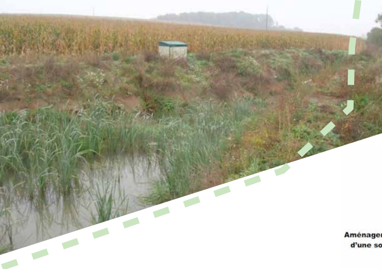
Un site revégétalisé "naturellement", 1 an après sa création