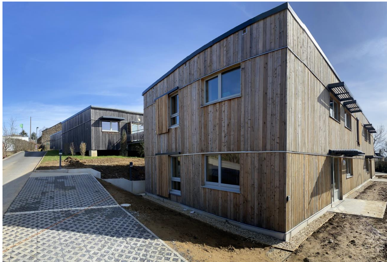
Dalles alvéolaires sur structure réservoir