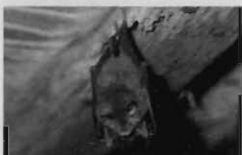
Petit rhinolophe - F. Schwaab