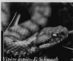
Vipère aspic - F. Schwaab