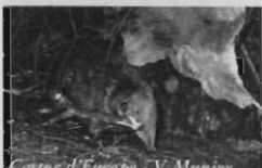
Castor d'Europe - V. Munier