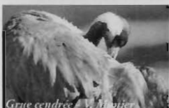
Grue cendrée - L. Munier