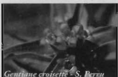
Gentiane croisette - S. Perzu