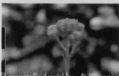
Immortelle des sables - P. Wernain