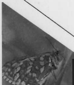
Damier de la saucisse - E. Sardet