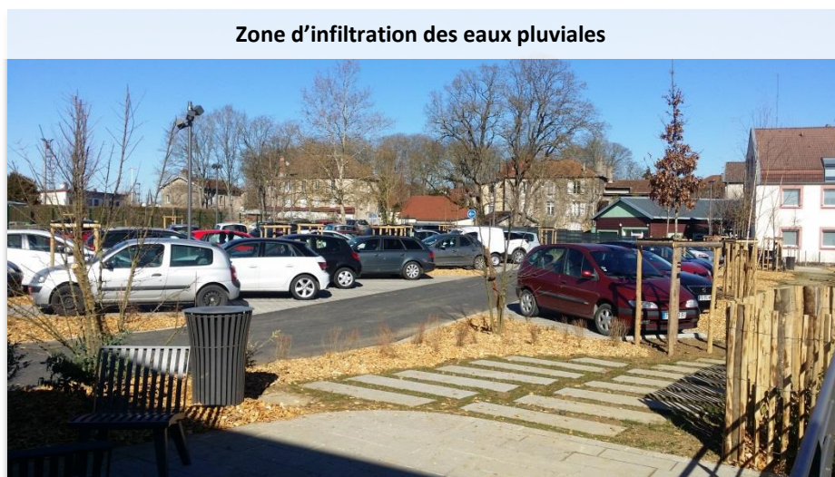
Zone d'infiltration des eaux pluviales